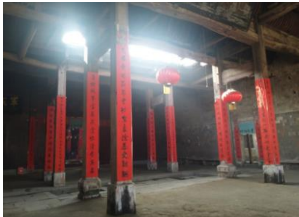
图 2：伍氏宗祠中堂楹联